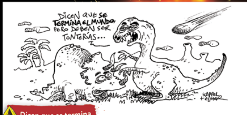
Dicen que se termina