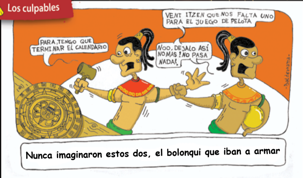
Nunca imaginaron estos dos, el bolonqui que iban a armar