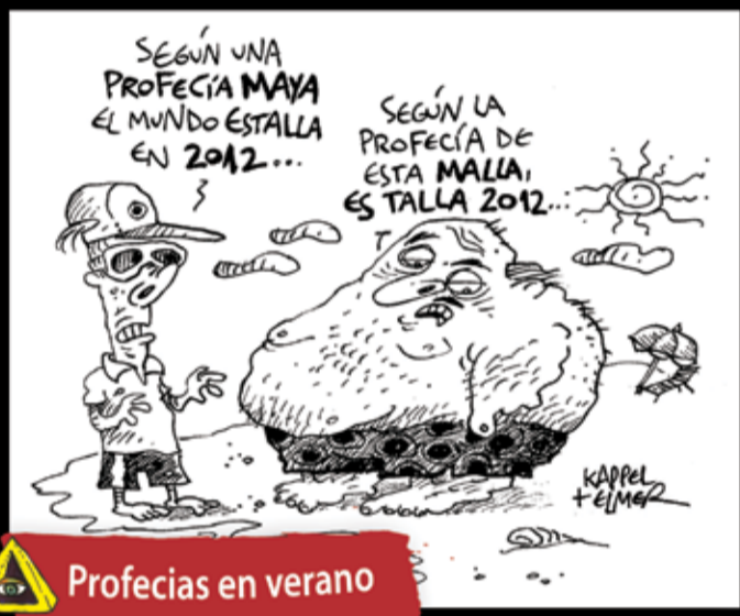
Profecias en verano