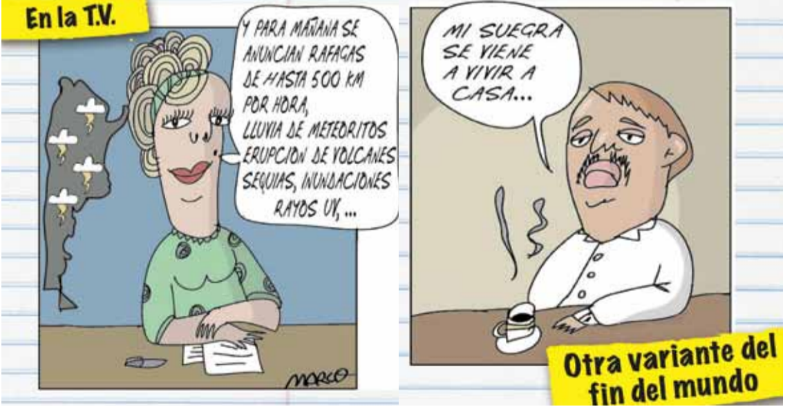
Otra variante del fin del mundo