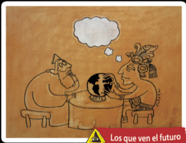
Los que ven el futuro